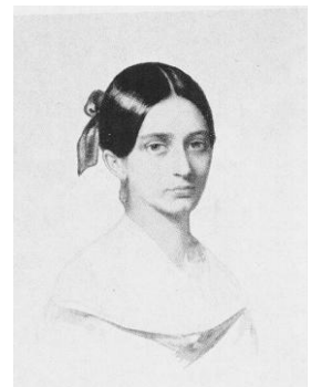
Clara Schumann (1819-1896)