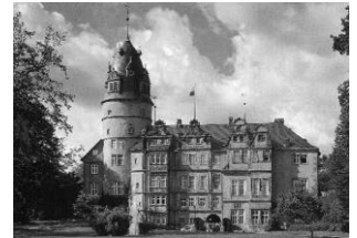
Das Schloss in Detmold – Brahms' Arbeitsplatz von 1858-1860

Erstaufführung am 10. Februar 1860 in Hamburg unter Leitung des Komponisten