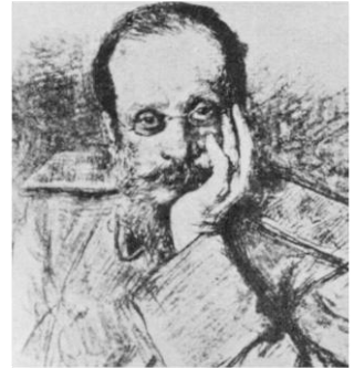
Cesar Cui 1835-1918