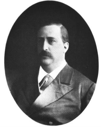
Alexander Borodin 1833-1887

Als Borodin im November 1862 wieder in Petersburg eintrifft, beginnt für ihn eine neue Phase: Er gilt als anerkannter Wissenschaftler und erhält unmittelbar nach seiner Ankunft einen Lehrstuhl für Chemie an der Medico-Chirurgischen Akademie, den er bis zu seinem Lebensende innehat. Daneben unterrichtet er an der Forstakademie und unterstützt nachdrücklich die medizinische Ausbildung von Studentinnen, was im Russland der damaligen Jahre absolut unüblich ist. Seine Karriere als Chemiker hält unvermindert bis an sein Lebensende an und er bringt mit seinen Forschungen die damalige organische Chemie in wichtigen Teilbereichen entscheidend weiter. Musikalisch prägt ihn besonders die Bekanntschaft mit Miliij Balakirew ab 1862. Dieser erkennt Borodins Talent, ermuntert ihn zum