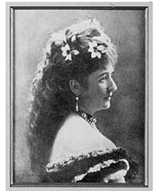
Gräfin Louise Mercy - Argenteau machte Borodin in Belgien bekannt.

Besetzung: 2 Flöten, 2 Oboen, 2 Klarinetten, 2 Fagotte, 4 Hörner, 2 Trompeten, 3 Posaunen, Pauke, Streicher