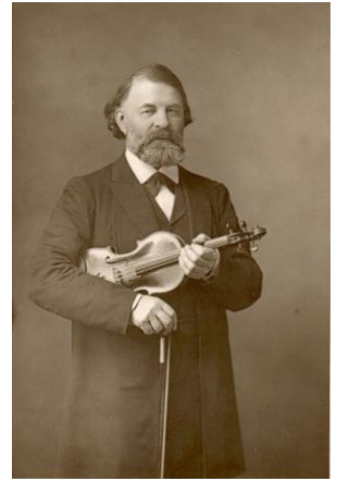
Joseph Joachim (1831-1907)

Der Zufall wollte, dass die beiden Seraden gegen Ende des Jahres 1860 gleichzeitig veröffentlicht wurden. Die erste hatte es leichter sich beim heimischen Publikum einzubürgern als die weit intimere zweite. Diese wurde vor allem im englischen Sprachraum hoch geschätzt und hat sich von dort ihren festen Platz in den Konzertsälen erobert. rb