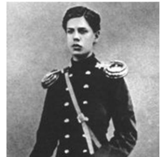
Modest Mussorgsky während seiner Zeit an der Kadettenschule um 1856