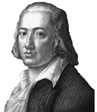
Friedrich Hölderlin (1770-1842)

Doch uns ist gegeben, Auf keiner Stätte zu ruhn, Es schwinden, es fallen Die leidenden Menschen Blindlings von einer Stunde zur andern, Wie Wasser von Klippe Zu Klippe geworfen, Jahr lang ins Ungewisse hinab.