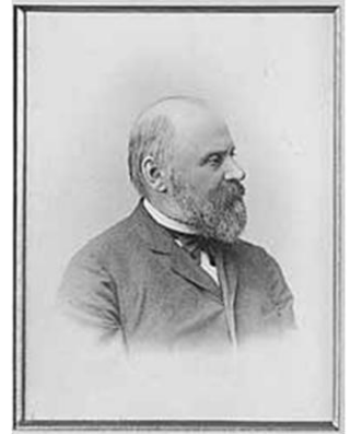
Milij Balakirew 1836-1910

Das Scherzo in D-Dur beginnt mit einem rustikalen Ostinato auf drei leeren Saiten der Geigen. Darüber legt sich ein von Holzbläsern eingeführtes, rhythmisch stark akzentuiertes Thema. Es wird vom ganzen Orchester aufgegriffen, dann folgt ein Einschnitt und fast im halben Tempo, rhythmisch verändert – nun im \frac{2}{4} - statt im \frac{3}{8} -Takt - beschließt das Hauptthema den Abschnitt. Drei ähnlich strukturierte