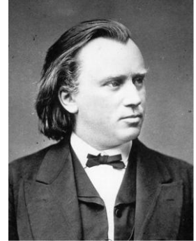
Johannes Brahms um 1860

Darauf antwortete Brahms nicht direkt, schickte aber am 10. September 1859 zum Geburtstag der Freundin die damals fertigen drei ersten Sätze, wobei er schrieb: